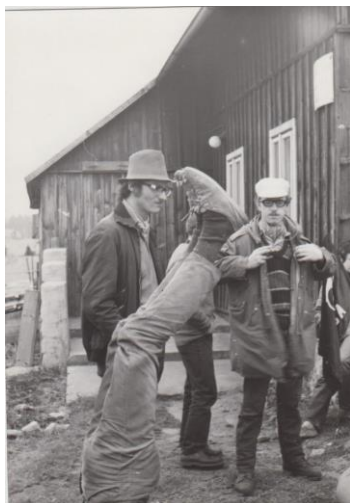
Chodouňák, ..... Vráťa