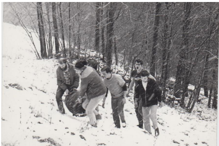
.....,sud piva, ....., ....., Chodouňák, .....