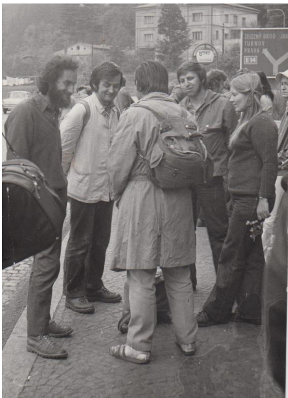
Prťák, Hif, Pavka, Pták, Bohuna