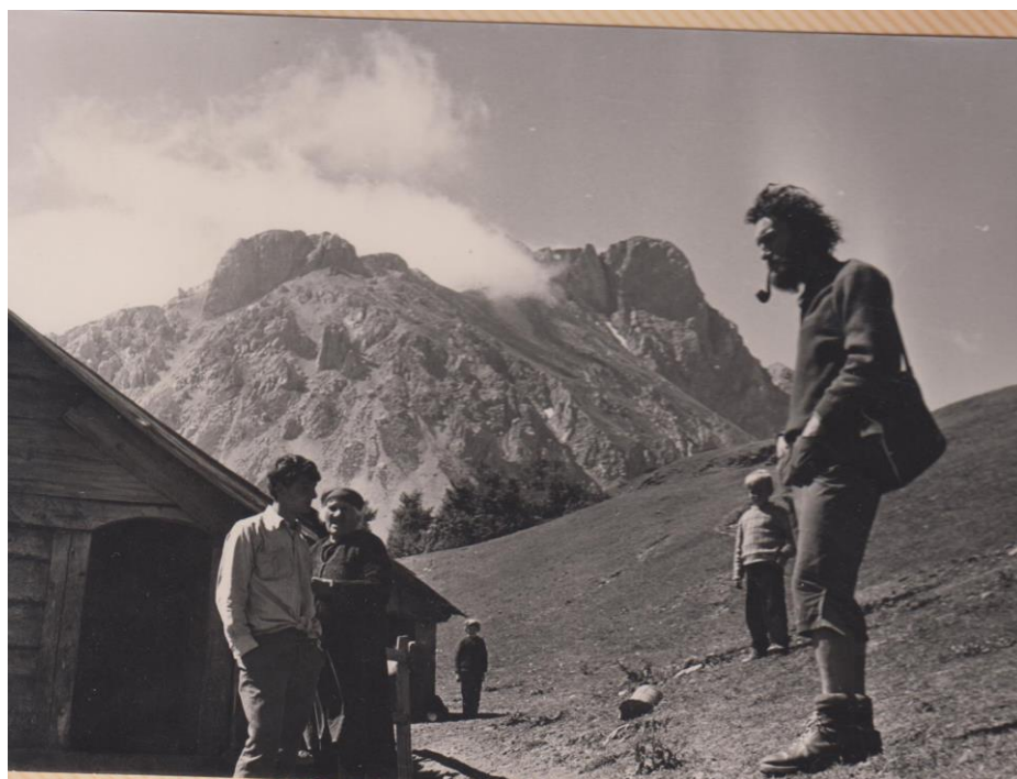
domorodci na Komovi a Prťák