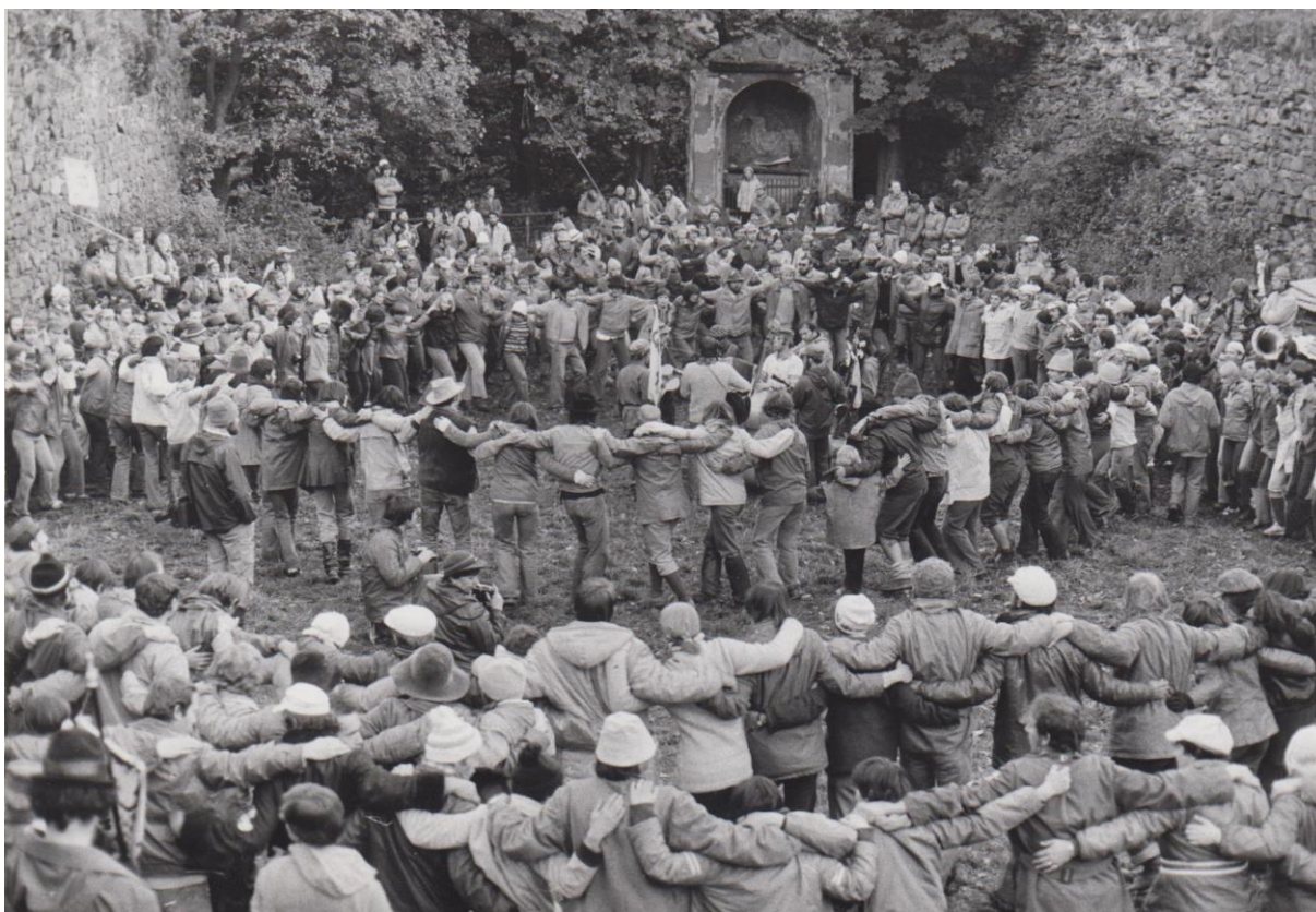
Asi už jsme zapomněli na HOKY KOKY a LABADU

Abychom nezapomněli úplně všechno, pokusil jsem se zde zaznamenat pár vzpomínek na prvních dvanáct let existence trasy. 50 let trvání trasy nelze jen tak přehlédnout.