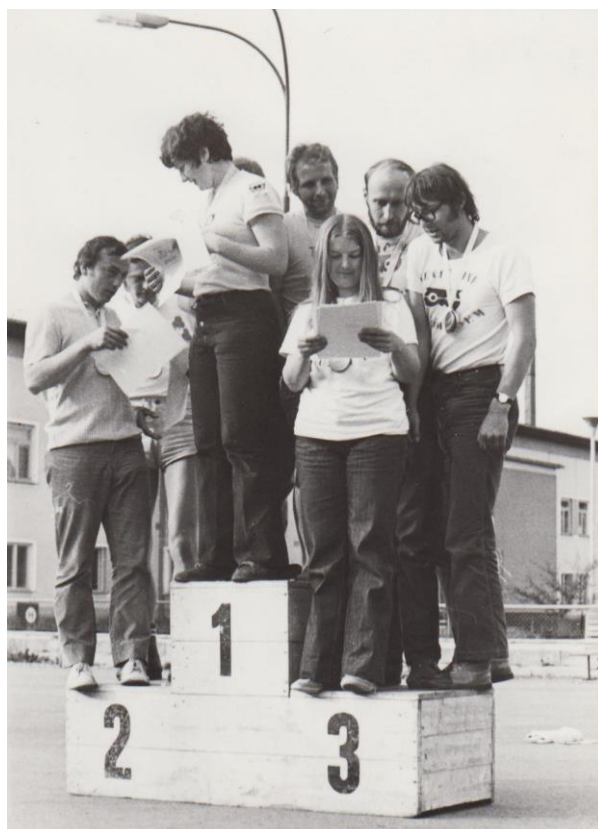
....., ....., ....., ....., Bohuna, Ánri, Gilík