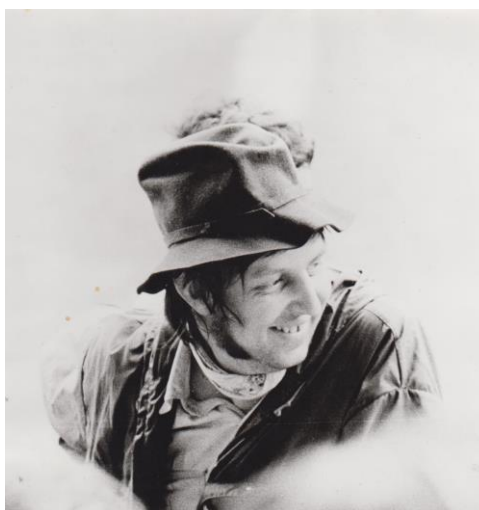
Tak tohle jsem já, coby šéf trasy

Abychom nezapomněli úplně všechno, pokusil jsem se zde zaznamenat pár vzpomínek na prvních dvanáct let existence trasy. 50 let trvání trasy nelze jen tak přehlédnout.